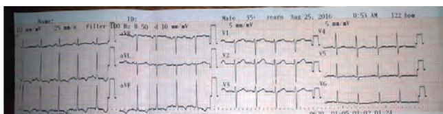
Figura 3. Electrocardiograma

El paciente permanece en la sala de emergencias, al no contar con espacio físico en una sala de cuidados intensivos, presentando paulatinamente mayor taquipnea, con diaforesis, e insuficiencia respiratoria y llegando al choque con datos de frialdad generalizada, taquicardia, hipotensión, se decide el manejo avanzado de la vía aérea con intubación orotraqueal, y apoyo ventilatorio, se decidió infusión de cristaloides en bolo, con pobre respuesta, permaneciendo en hipotensión a pesar de las cargas de volumen, presentó esporádicamente contracciones musculares distales hipertónicas y deterioro neurológico, llegando al Glasgow de 3/15, se inició vaso activos tipo dopamina a dosis altas (20 ug/kg/min) sin respuesta, catalogándose como choque circulatorio refractario,