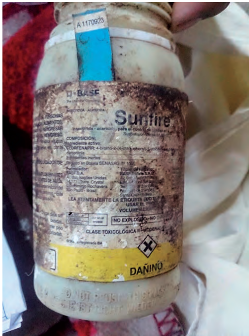
Figura 1. Presentación del Clorfenapir