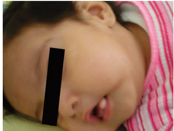
Fig. 6. Paciente con Síndrome de Pierre Robin.

Se evidencia micrognatia, glosoptosis, mucocele lingual y orejas de implantación baja. 3