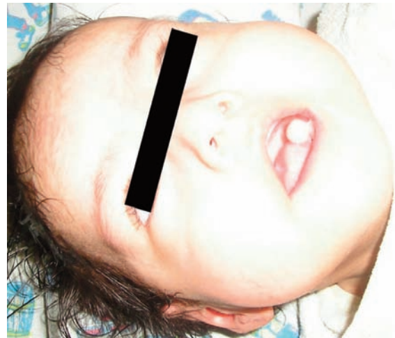
Se evidencia micrognatia y mucocele lingual.

Al observar la severidad del cuadro es derivada al Servicio de cuidados intermedios de pediatría (Medicina I), y una vez estabilizado el cuadro es referido el 25 de febrero al Centro de Rehabilitación Integral Nutricional (CRIN), con un peso de 3,82 kg y una talla de 55cm. Durante su estancia en esta sala manifiesta nuevamente un cuadro respiratorio que corresponde a una neumonía atípica por lo que es referido nuevamente al servicio de cuidados intermedios para su manejo (Medicina II). Llamó la atención en este servicio el hecho de que la paciente tenía una curva de crecimiento estacionaria aún brindándole los requerimientos calóricos y proteicos del soporte nutricional implementado; no evidenciaba mejoría en el peso aún con un incremento periódico en la ingesta. De hecho la gráfica sobre el peso no tenía fluctuaciones relevantes incluso en el 53º día de internación, manifestando una Desnutrición Crónica, este hecho generó preocupación en el equipo médico y condujo a plantear la sospecha de alguna patología