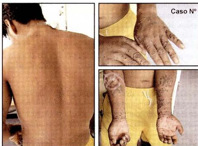
Caso 1: Lesiones por picadura de PSEUDOMYRMEX SPP en zonas expuestas