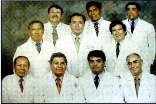
Autores del libro Normas y Procedimientos en Obstetricia. Médicos de la Maternidad CNS.

arrollo físico y mental de la nueva población en condiciones favorables.