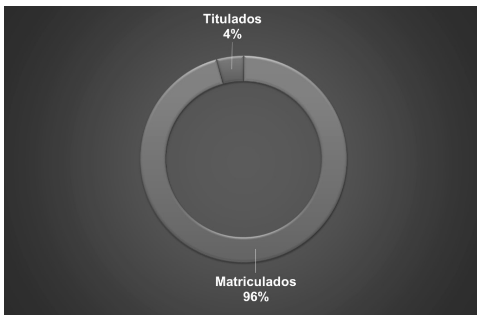
Figura 1 Brecha entre universitarios matriculados y titulados en el Departamento de La Paz correspondiente al año 2016