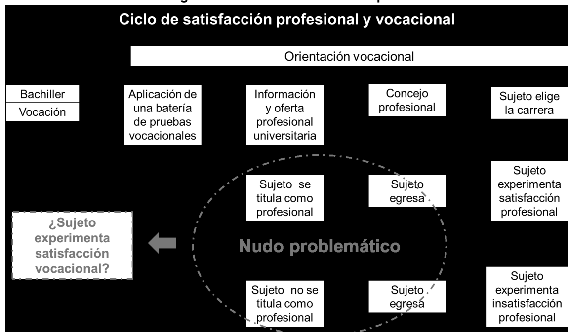
Figura 3 Proceso vocacional completo

esquema, que se muestra en la siguiente Figura: