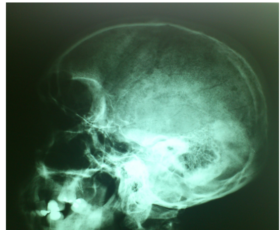
Figura 2. Radiografía de cráneo con lesiones líticas