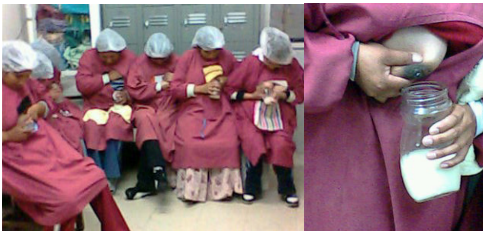
Figura 1. Madres durante la extracción manual de leche

El procedimiento para determinar el volumen extraído fue el siguiente: