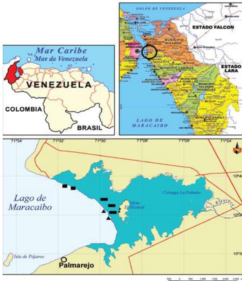
Figura 1. Área de estudio Reserva de Fauna Silvestre Ciénaga de La Palmita e Isla de Pájaros, estado Zulia, Venezuela (Con permiso de: Vera et al., 2010).

La Reserva de Fauna Silvestre Ciénaga de La Palmita e Isla de Pájaros representa el área de transición entre la zona continental y el Lago de Maracaibo, donde recibe aportes del río Aurare (De Olivares, 1988), y del Lago de Maracaibo a través de tres entradas constituidas por caños sometidos a regímenes de marea. La precipitación media anual es de 400 a 500 mm, con un patrón bimodal. El período seco se presenta de diciembre a marzo y de junio a agosto, y el lluvioso de septiembre a noviembre y de abril a mayo (Aguilera y Riveros, 1993).